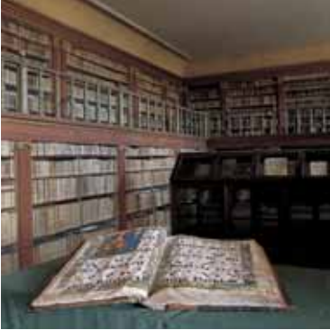
Biblioteca del Monasterio de Yuso SAN MILLÁN DE LA COGOLLA