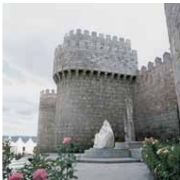
Muralla e imagen de Santa Teresa ÁVILA