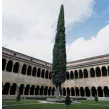
Ciprés de Silos SANTO DOMINGO DE SILOS