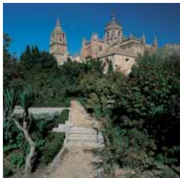
Huerto de Calixto y Melibea SALAMANCA