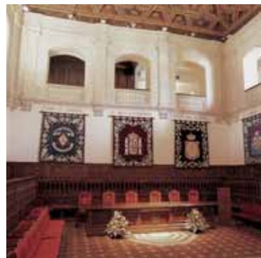
Paraninfo Universidad ALCALÁ DE HENARES

para ello pensó en el “apadrinamiento”, a través de escritores. Que cada ciudad solicitara a un escritor que respaldase la señal, redactando un texto sobre ese hito del Camino e incluyéndolo en la señal.