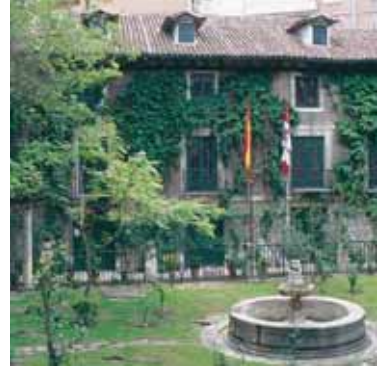
Casa de Cervantes VALLADOLID